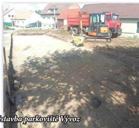
Výstavba parkoviště Vývoz