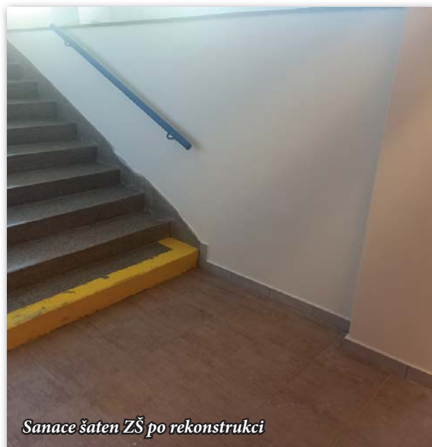
Sanace šaten ZŠ po rekonstrukci