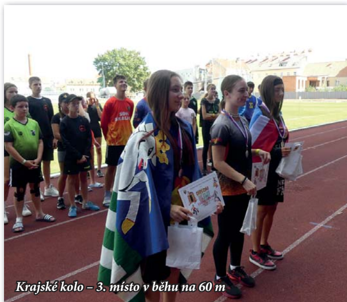
Krajské kolo – 3. místo v běhu na 60 m