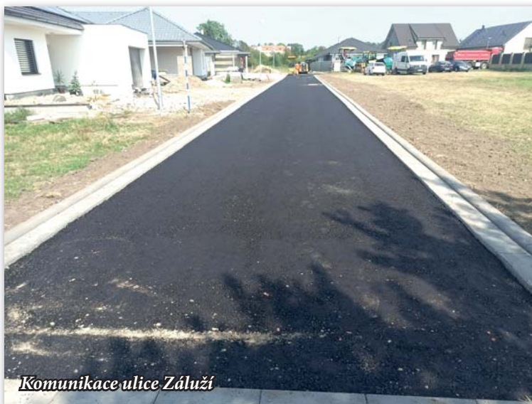
Komunikace ulice Záluží