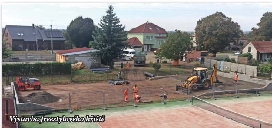
Výstavba freestyleového hřiště