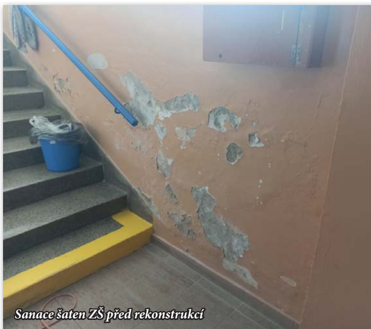
Sanace šaten ZŠ před rekonstrukcí