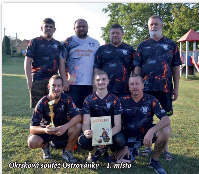
Okrsková soutěž Ostrovánky – 1. místo