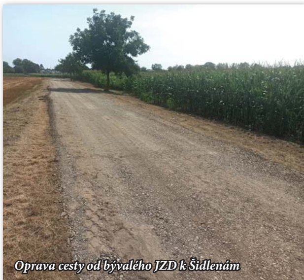
Oprava cesty od bývalého JZD k Šidlenám