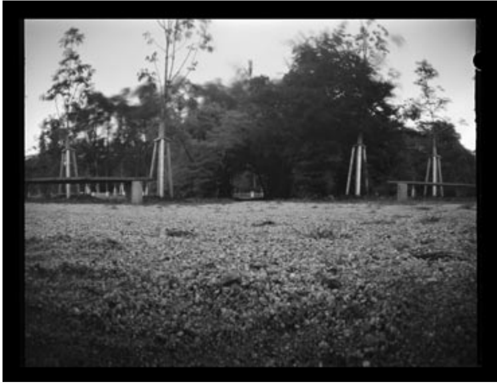
Zahrada zámku / Schlossgarten