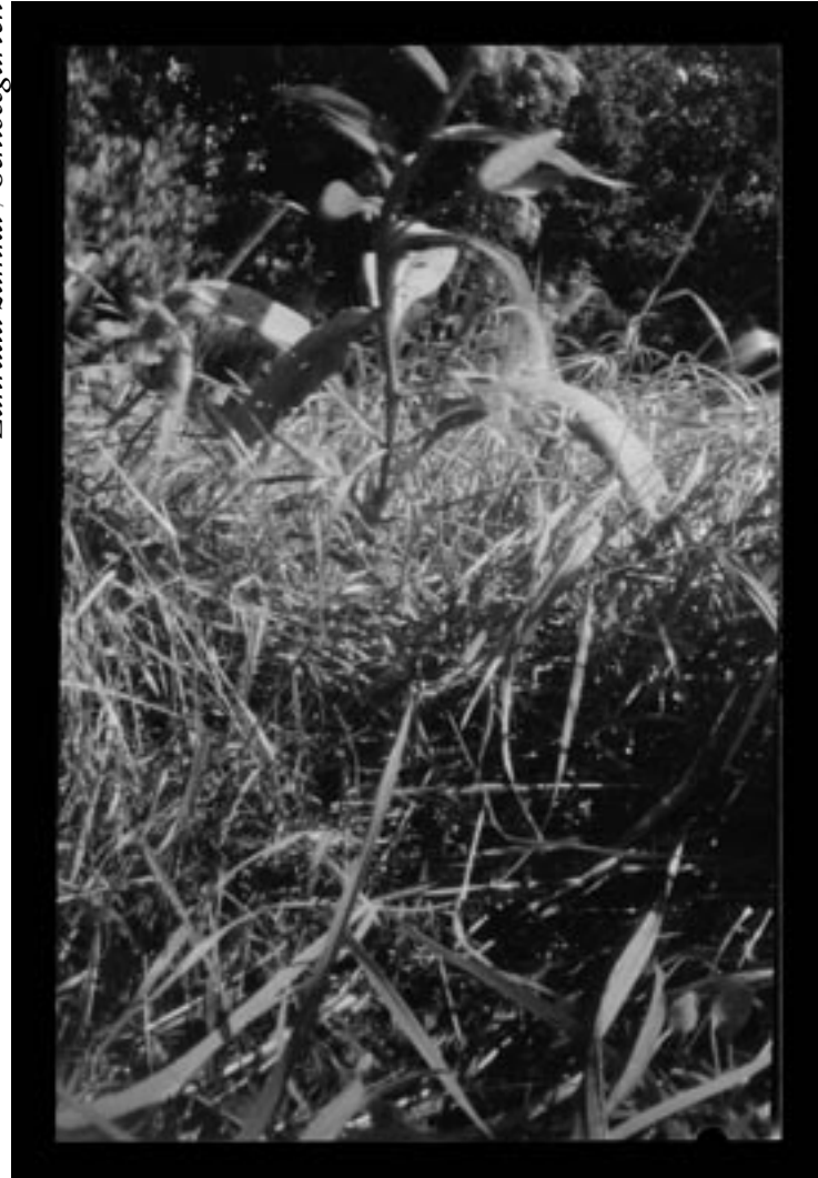
Zahrada zámku / Schlossgarten